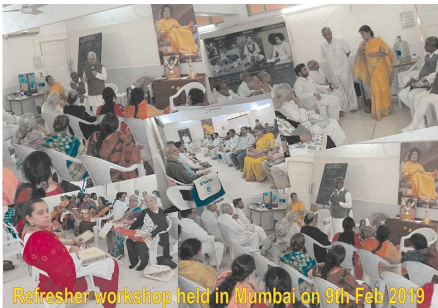
Refresher workshop held in Mumbai on 9th Feb 2019

Высший информативный и интерактивный курс повышения квалификации, в котором участвовало